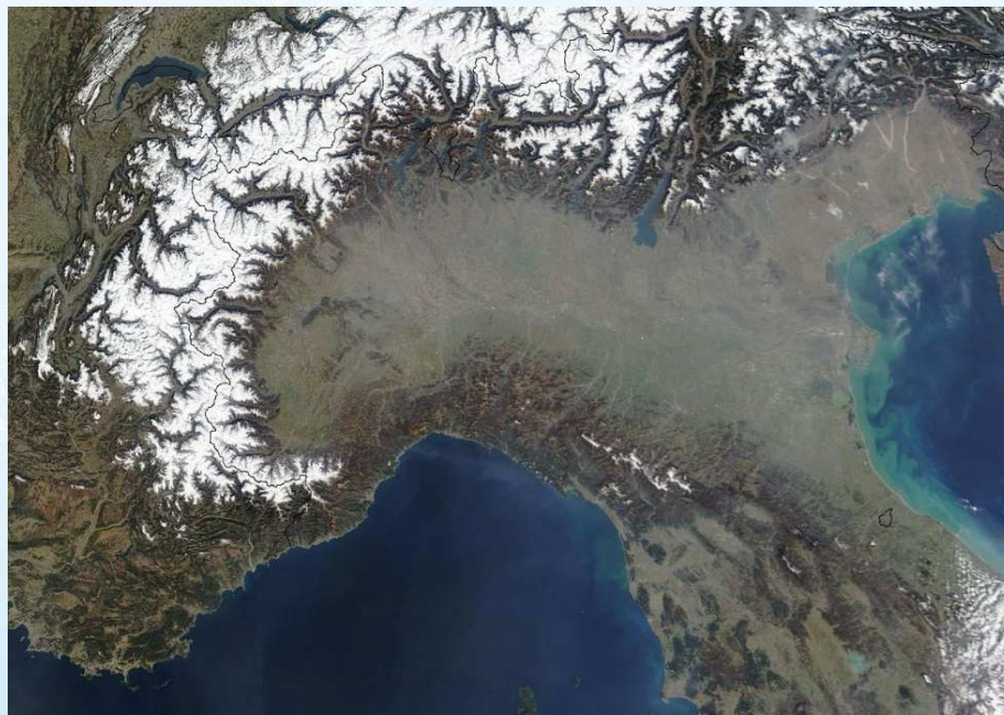
Satellite Image of Northern Italy in the winter season