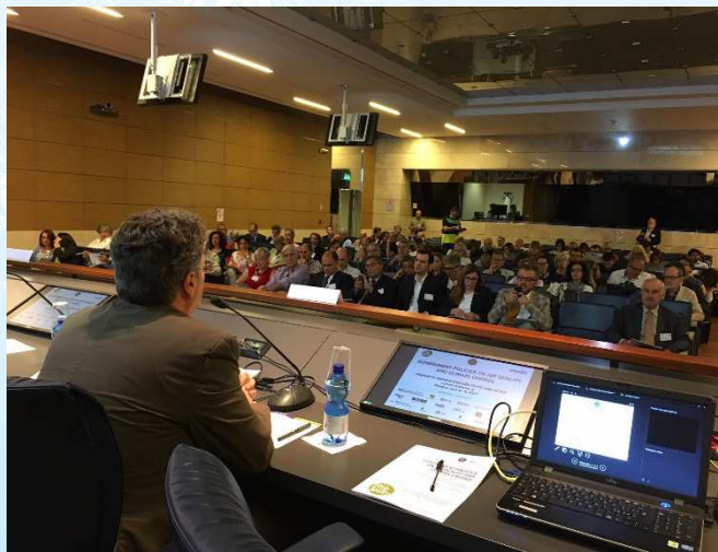
PREPAIR CONFERENZA INIZIALE 8-9 Giugno 2017